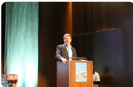
Utviklingsminister Åsmund Grøver Aukrust (Ap) holdt åpningshilsen på Kildens årskonferanse.