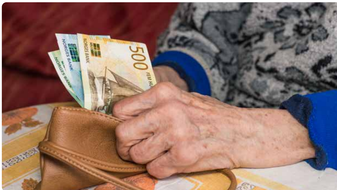
Eldre kvinner er overrepresentert i lavinntektsgrupper og blant dem med lav digital kompetanse. Til tross for lav inntekt, opplever mange enker økt formuesskatt fordi bunnfradraget halveres når ektefellen dør.

Skatteunndragelse undergraver progressiv beskatning og likestilling. Norske undersøkelser viser at menn er overrepresentert blant dem som kjøper svart arbeid, mens kvinnelige selvstendig næringsdrivende i Norge er overrepresentert i underrapportering av inntekt.